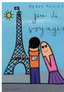
〈여행놀이〉 (루크북스) "Jeu de voyages"

Hervé Tullet est né en 1958. Après avoir fait des études d'Arts plastiques et d'Arts décoratifs, il réalise, en 1990, ses premières illustrations pour la presse en France et à l'étranger et publie son premier livre pour enfants en 1994. Depuis, il se consacre à l'illustration et à la peinture.