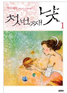
〈첫번째 날〉 (열림원) "Le Premier Jour"

Marc Levy publie son premier roman "Et si c'était vrai" en 2007. Depuis, tous ses romans figurent, dès leur parution, en tête des ventes annuelles en France et connaissent un succès international. Traduits en 41 langues, ses ouvrages ont été tirés à plus de 20 millions d'exemplaires.