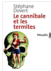
"Le cannibale et les termites"