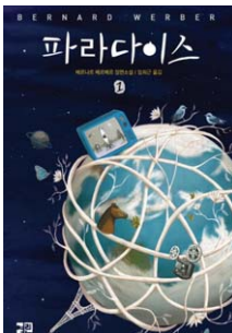
〈파라다이스〉 (열린책들) "Paradis sur mesure"

Ancien journaliste scientifique, Bernard Werber connaît son premier succès avec “Les fourmis”, publié en 1991, et fait une irruption remarquée sur la scène littéraire. Un succès qui depuis ne cesse de se confirmer avec des ouvrages traduits dans plus d’une vingtaine de langues.